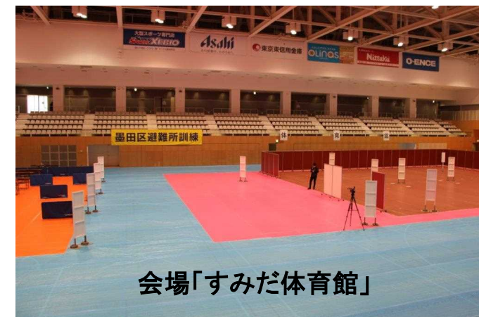
会場「すみだ体育館」