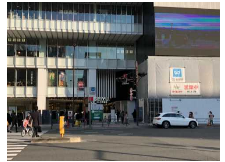
現在の楽天地まわり