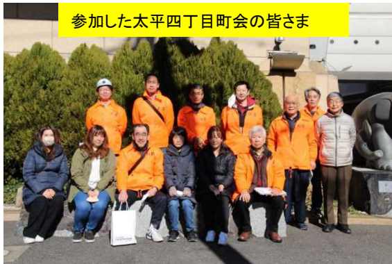
参加した太平四丁目町会の皆さま

3年ぶりの太平連合町会防災訓練は、当町会が幹事役で本所防災館にて開催し、当町会から14名、計44名の参加で、各種体験をしました。