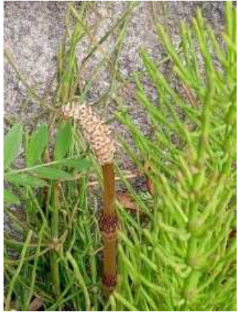
【撮影】業平5丁目柳島橋付近