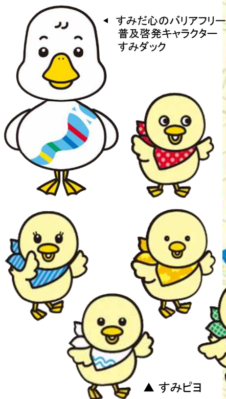
◀ すみだ心のバリアフリー 普及啓発キャラクター すみダック