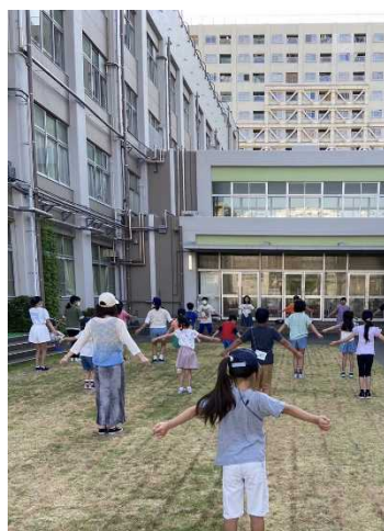
地域ラジオ体操の様子