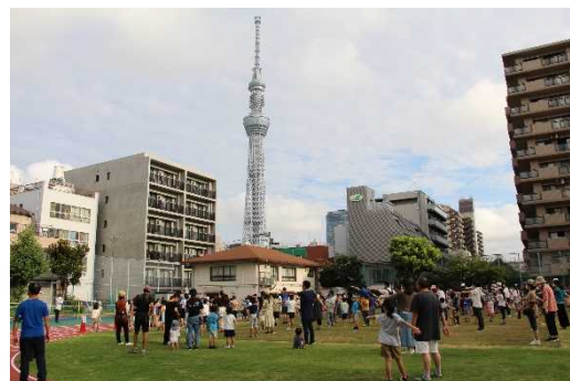
柳島合同ラジオ体操の様子

最終日は子どもたちに参加賞のお菓子とジュースを配りました。皆嬉しそうにもらって帰りました。