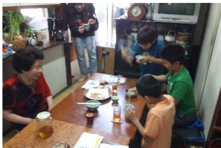
ミニ講習会の様子