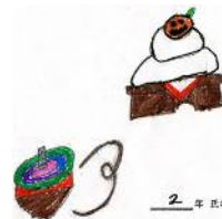
2 年 生 鐘江智仁