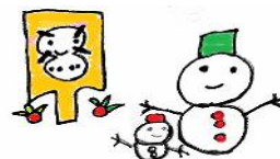
1 年 生 さしほまろま