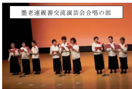
墨老連親善交流演芸会合唱の部

昨年は「新年会」に始まり、「春のお花見」「墨老連の旅行」「暑気払い」「お誕生日会」等又、第三地区の「演芸大会」へも合唱で参加しました。一年の締めくくりに東武ホテルでの「お食事会」には沢山の方が参加していただき、和気あいあいと楽しく過ごすことが出来ました。毎年行っている「タオルの供出」にもご協力を頂きありがとうございます。「業平ホーム」と「柳島幼稚園」