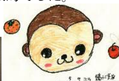
5 年 生 鐘江智仁