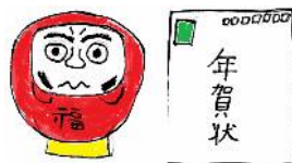
4 年 生 さしほまろま

12月25日に子ども会の子もたちが町会の方々と一緒に町会会館前から出発し夜回りを行いました。とても寒い中、子どもたちは大きな声で火の用心!!と声を揃えて町内を練り歩きました。子ども会の年間行事で最後でしたがたくさんの参加があり、防犯・防災を呼びかけることが出来ました。