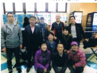
ボーリング大会頑張りました！

参加者は10名と少々寂しかったのですが、怪我も無く無事に終了致しました。2ゲーム行い、トータルで優勝を決めるのが常道ですが、今回は2ゲームトータルのスコアの低い人でも上位入賞できるシステムです。結果は個人情報なので公表は差し控えますが、自己申告と実際のスコアが1ピン差の人が2名出ました。