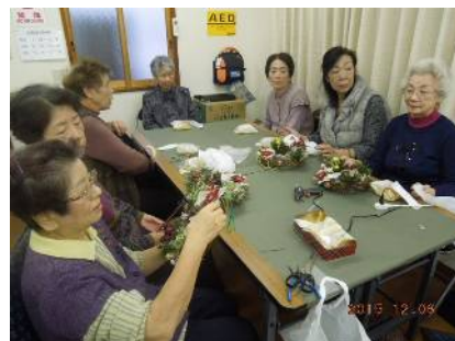
クリスマスリース教室風景