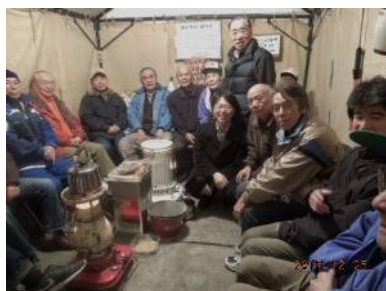
歳末警戒テント内風景

ご町内の皆様、あけましておめでとうございます。昨年中は防犯部・防災部の活動にご協力を頂き、心から感謝申し上げます。又、恒例になっております「歳末警戒」につきましては、皆様のご参加を頂き、無事に終了いたしました。12月25日には、子ども会の皆さんに大勢のご参加を頂き、誠にありがとうございました。本年も我が街の「安全と安心」を目指して頑張っております。本年もよろしく願いいたします。