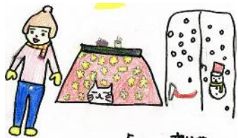
5 年 生 齋藤菜乃