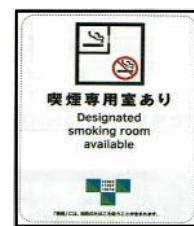
喫煙専用室あり Designated smoking room available 施設等標識